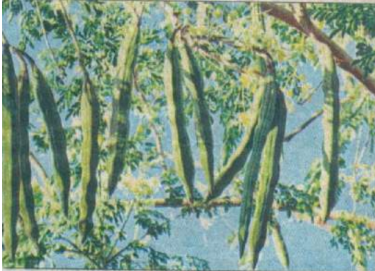
मुनगा की फल्लियाँ

मुनगा की पत्तियाँ संयुक्त एवं त्रिपालिक तथा 30 से 60 से.मी. तक लम्बी होती हैं। प्रत्येक पत्ती में पिन्नी के 4 से 6 जोड़े एक-दूसरे से विपरीत दिशा में होते