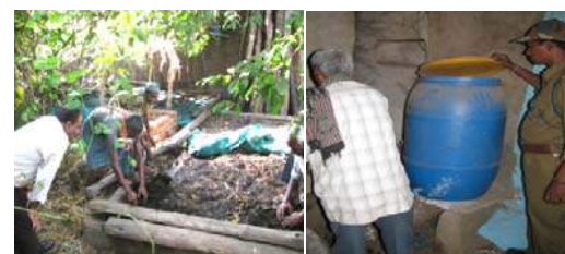
Fig. 2: Production of Vermicompost and Vermivash by SHG at Shivtarai, Achanakmar-Amarkanatak biosphere reserve.