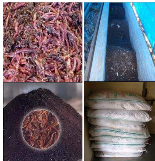
Fig. 1: Vermi composting

production and selling earthworms, vermicompost and vermivash to the Forest Department, farmers and plant growers (Fig. 2). Scientist of Lead Institute, Tropical Forest Research Institute, Jabalpur (MP), has developed complete package of vermicompost and vermivash production using forest litters of different species, dose of application and economic analysis.