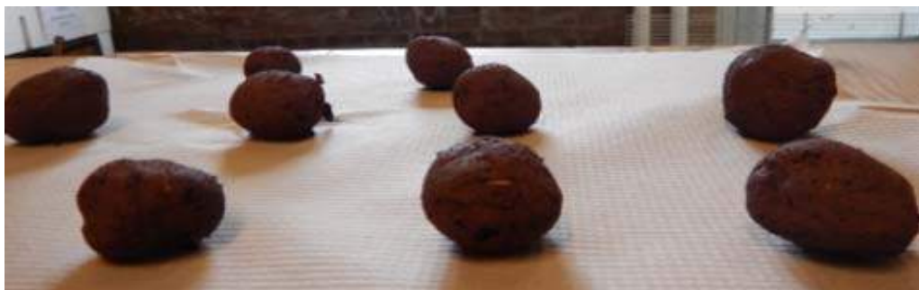
Fig. 2: Seed balls, prepared at Vikarabad district, Telangana