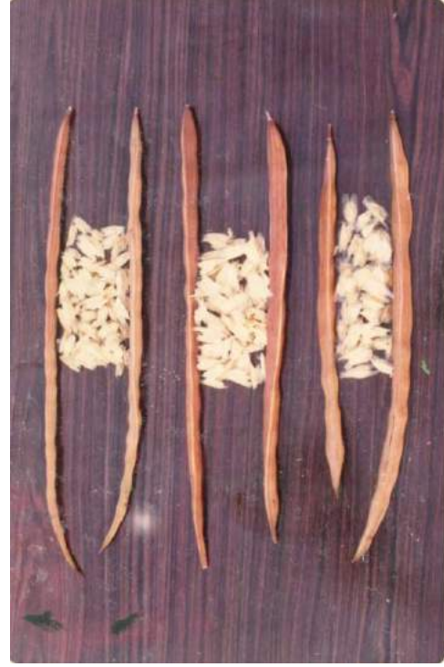
मुनगा की परिपक्व फल्लियाँ एवं पंखदार बीज

किलोग्राम बीजों की संख्या 8 हजार से 9 हजार तक होती है।