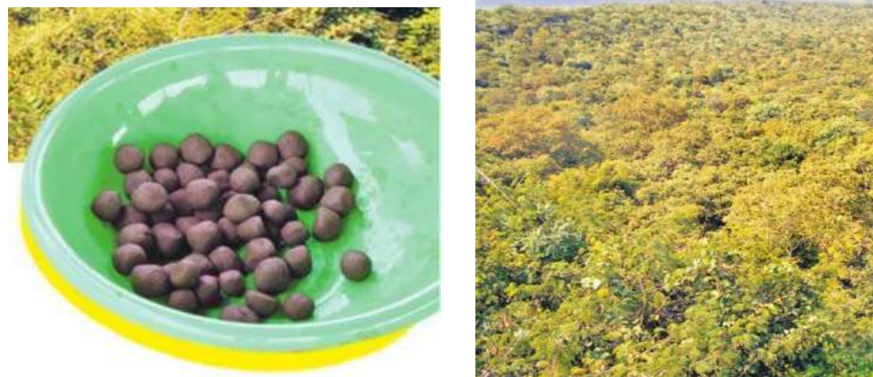
Fig. 3: Ready to spread seed balls, Ananthagiri forest vegetation of Vikarabad district, Telangana