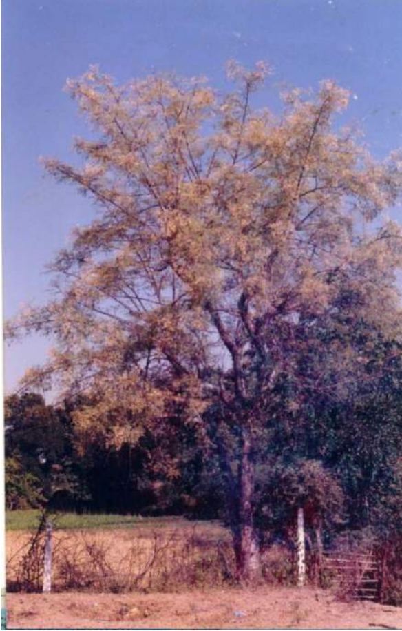
मुनगा का वृक्ष

मुनगा, मोरिंगेसी कुल का लघु या मध्यम ऊँचाई का,