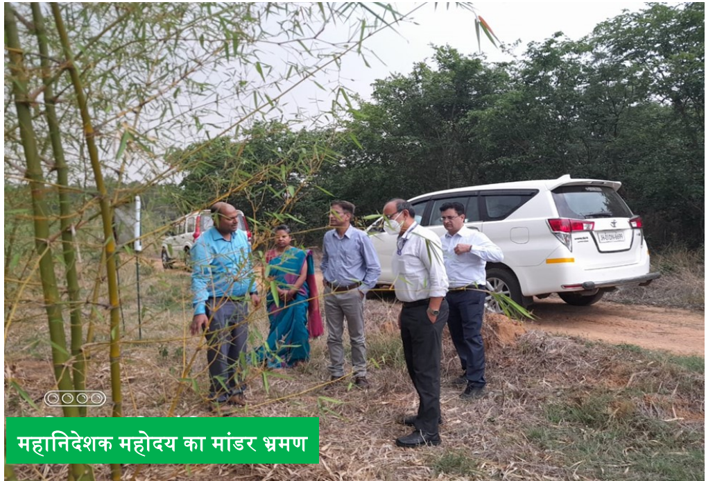
महानिदेशक महोदय का मांडर भ्रमण