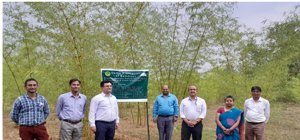
महानिदेशक महोदय का मांडर भ्रमण