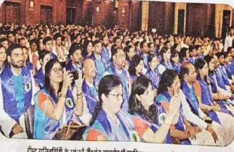
डीमड यूनिवर्सिटी के पांचवें दीक्षांत समारोह में उपस्थित छात्र-छात्राएं।

उत्सवाखंड की डिग्री सिक्ट को मिलने दो अवार्ड उत्सवाखंड की डिग्री सिक्ट को दो गोल्ड मेडल मिले हैं। एक योल्ड मेडल वुड सर्विस व टेक्नोलॉजी में प्रथम आने पर और दूसरा अवार्ड शास्य पसेवट इंटरटी कोलकाता की ओर से दिया गया। डिग्री सिक्ट के पिता योहन सिक्त सिक्ट ऑर्डिनेंस फेक्टरी में कार्य करते हैं। याल गृहिणी हैं।