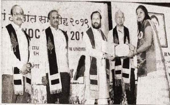
दीक्षांत समारोह के दौरान छात्रा को डिग्री प्रदान करते प्रकाश जावड़ेकर।

शनिवार को भारतीय वन अनुसंधान संस्थान के सभागार में एफआरआई डीम्ड यूनिवर्सिटी के दीक्षांत समारोह को बतौर मुख्य अतिथि संबोधित कर रहे थे। इस मौके पर पीएचडी व परास्नातक छात्रों को डिग्री प्रदान की गई। कार्यक्रम में नौ छात्रों को गोल्ड मेडल प्रदान किए गए। केंद्रीय मंत्री ने कहा कि जल, जंगल और जमीन को बचाने और इससे समृद्धि लाने के लिए केंद्र सरकार बहुत जल्द बड़ी योजना शुरू