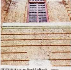
एफआरआइ के भवन पर दिखाई दे रही दरारें

केंद्रीय मंत्री जावड़ेकर ने एफआरआइ परिसर में वनों की रक्षा करते हुए प्राण गंवाने वाले कार्मिकों की याद में बनाए गए शहीद स्मारक की सराहना की। उन्होंने निर्देश दिए कि इस स्मारक में वन संरक्षण का प्रतीक बने जोधपुर के शिरनोई समाज को भी स्थान दिया जाना न्यायोचित होगा। क्योंकि वर्ष 1730 में जोधपुर के महाराज अजय सिंह ने जब विशाल महल बनाने के लिए पेड़ों के कटान का आदेश दिया तो यह समाज पेड़ों से लिपट गया था। वन संरक्षण के लिए डटे शिरनोई समाज के 300 से अधिक लोगों को अपनी जान भी गंवानी पड़ी थी।