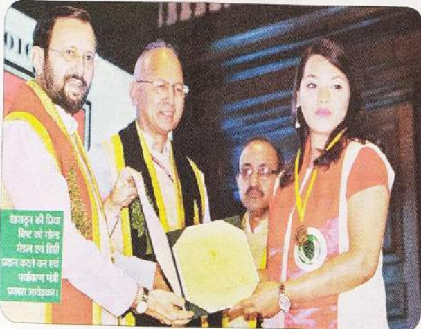
देहरादून की डिग्री सिक्ट को जल्द मंडल एवं डिग्री प्रदान करने वन एवं पर्यावरण मंत्री प्रकाश जावड़ेकर

दीक्षांत समारोह में पहुंचे केंद्रीय वन एवं पर्यावरण मंत्री ने की घोषणा