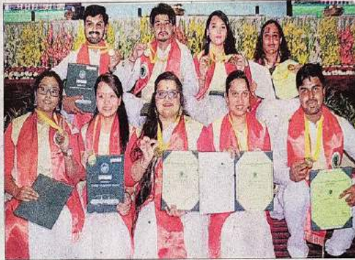
एफआरआई डीक यूनिवर्सिटी के दीक्षांत समारोह में शनिवार को गोल्ड मेडल जीतने वाले छात्रों ने खुशी का इजहार किया।

खाहिए न ही उसका काम किया हुआ दिखना चाहिए। उन्होंने राजस्थान के विरगोई ऑटोप्लान जैसे पर्यावरण ऑटोप्लान में और बलियान देने वाले फारेस्टर्स की यापारं भी सहेजने के लिए कहा।