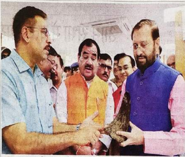
शनिवार को भारतीय वन्यजीव संस्थान में जेनेटिक लैब के उद्घाटन के दौरान वैज्ञानिकों से गैडे के असली व नकली सींग की जानकारी प्राप्त करते केंद्रीय मंत्री प्रकाश जावड़ेकर