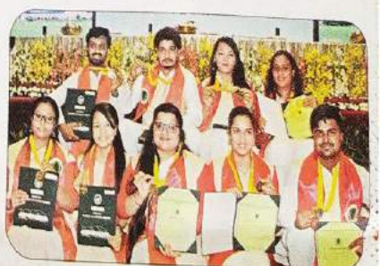
मेडल प्राप्त करने वाले छात्र-छात्राएं।