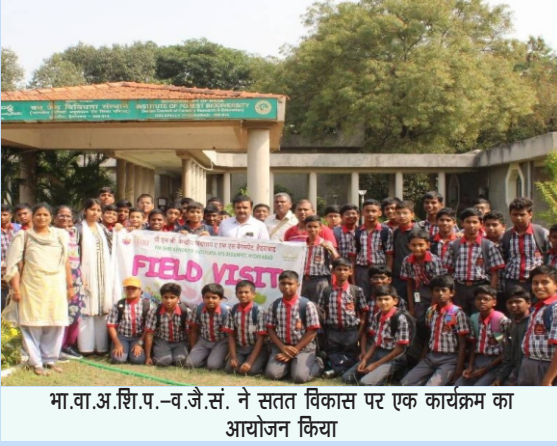
भा.वा.अ.शि.प.—व.जै.सं. ने सतत विकास पर एक कार्यक्रम का आयोजन किया