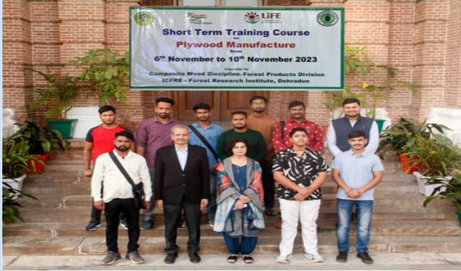
भा.वा.अ.शि.प.-व.अ.सं., देहरादून द्वारा "प्लाईवुड निर्माण" पर पांच दिवसीय अल्पकालिक प्रशिक्षण पाठ्यक्रम का आयोजन किया गया