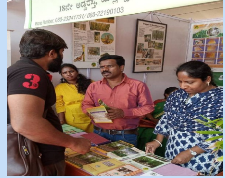
भा.वा.अ.शि.प.—का.वि.प्रौ.सं., बेंगलुरु ने कृषि मेला 2023 में एक स्टॉल लगाया