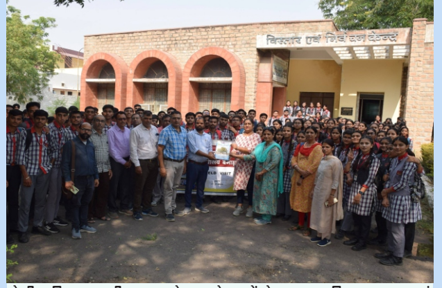
केन्द्रीय विद्यालय, बीएसएफ जोधपुर के छात्रों ने भा.वा.अ.शि.प.-शु.व.अ.सं. जोधपुर का दौरा किया