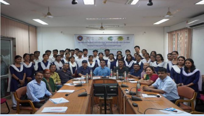
भा.वा.अ.शि.प.-व.व.अ.सं द्वारा जैवउर्वरक उत्पादन पर एक कौशल विकास प्रशिक्षण आयोजित किया गया