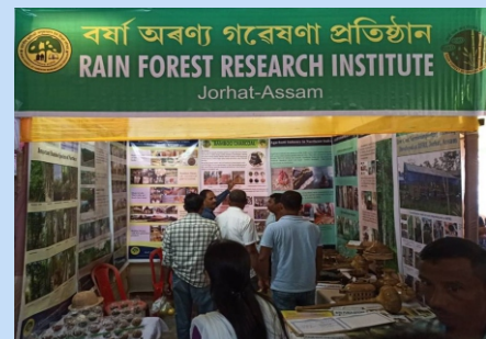
भा.वा.अ.शि.प.—व.व.अ.सं., जोरहाट ने तीताबर में किसान मेला में स्टॉल लगाया