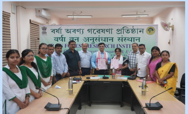
भा.वा.अ.शि.प.-व.व.अ.सं. और शिबसागर गर्ल्स कॉलेज, जोरहाट के बीच समझौता ज्ञापन पर हस्ताक्षर किए गए