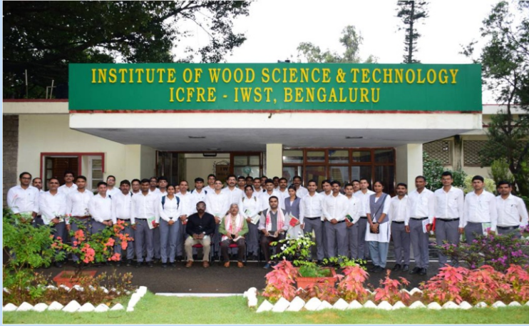
कैसफोस, बर्नीहाट, असम के राज्य वन सेवा प्रशिक्षुओं ने भा.वा.अ.शि.प.—का.वि.प्रौ.सं., बेंगलुरु का दौरा किया