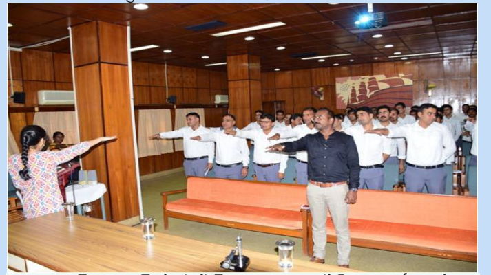
भा.वा.अ.शि.प.—का.वि.प्रौ.सं. में मिशन लाइफ पर संवेदीकरण कार्यक्रम और कैसफोस, बर्नीहाट, असम के 47 राज्य वन सेवा अधिकारी प्रशिक्षुओं द्वारा प्रतिज्ञा ली गई

भा.वा.अ.शि.प.—का.वि.प्रौ.सं. द्वारा मिशन लाइफ पर एक संवेदीकरण कार्यक्रम आयोजित किया गया और कैसफोस, बर्नीहाट, असम के 47 राज्य वन सेवा अधिकारी प्रशिक्षुओं द्वारा शपथ ली गई।