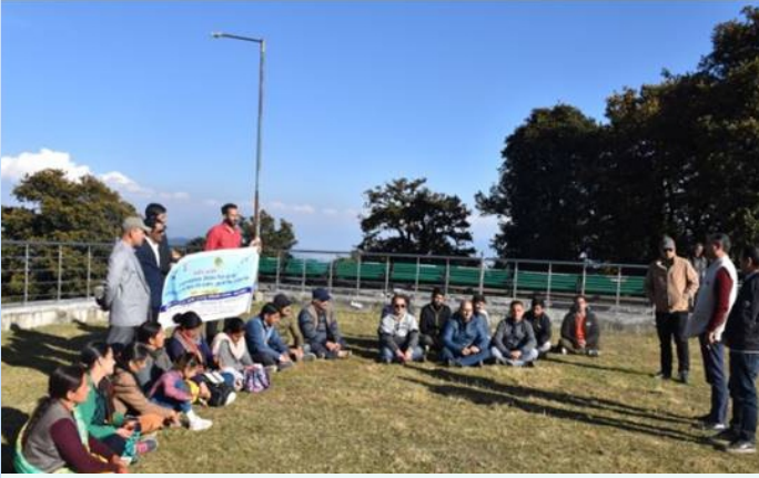
पारंपरिक जड़ी-बूटियों और औषधीय पौधों पर व्याख्यान

भा.वा.अ.शि.प.—हि.व.अ.सं., शिमला द्वारा नारकंडा में पारंपरिक जड़ी-बूटियों और औषधीय पौधों पर व्याख्यान दिया गया।