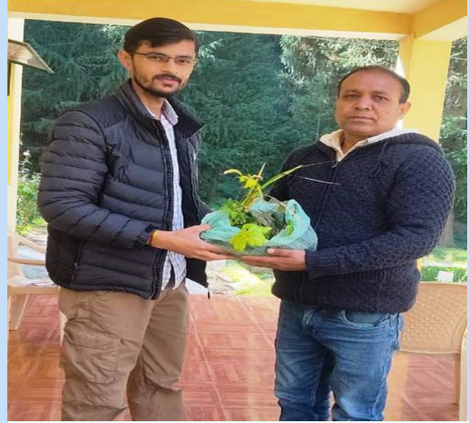
भा.वा.अ.शि.प.–हि.व.अ.सं., शिमला ने औषधीय पादप के नवोद्भिद वितरित किए