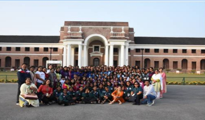
केन्द्रीय विद्यालय के 10 जून की छात्राओं को जागरूकता व्याख्यान

केन्द्रीय विद्यालय 10 जून की 152 छात्राओं को मिशन लाइफ के बारे में जागरूकता व्याख्यान दिया गया।