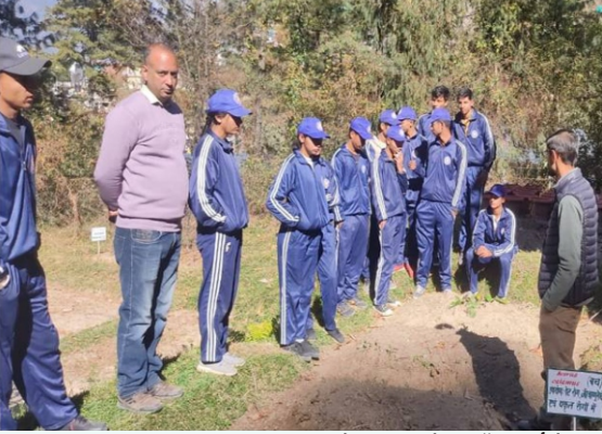
राजकीय वरिष्ठ माध्यमिक विद्यालय, जगतसुख के एनसीसी के 15 वॉलंटियर्स ने वन विज्ञान केंद्र, जगतसुख, मनाली का दौरा किया