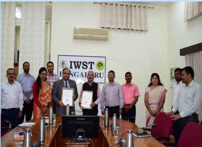
भा.वा.अ.शि.प.-का.वि.प्रौ.सं. और सीपीपीआरआई, सहारनपुर के बीच समझौता ज्ञापन पर हस्ताक्षर किए गए