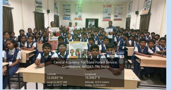
मिशन लाइफ से संबंधित जागरूकता सामग्री का वितरण

भा.वा.अ.शि.प.—व.आ.वृ.प्र.सं. द्वारा विभिन्न स्कूली छात्रों को मिशन लाइफ से संबंधित जागरूकता सामग्री वितरित की गई।