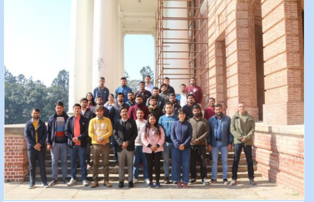
भा.वा.अ.शि.प.—वन अनुसंधान संस्थान, देहरादून द्वारा आयोजित एक दिवसीय हिंदी प्रशिक्षण कार्यशाला