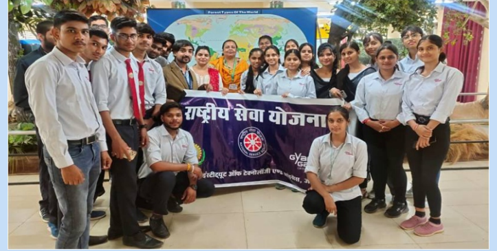
वन रेंजर कॉलेज बालाघाट (मध्यप्रदेश) के 49 वन रक्षकों और पीएम केंद्रीय विद्यालय जबलपुर के 367 छात्रों को उ.व.अ.सं. प्रौद्योगिकियों का प्रदर्शन किया गया