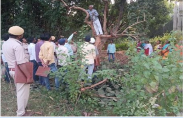
लाख की खेती पर आयोजित प्रशिक्षण कार्यक्रम

भा.वा.अ.शि.प.—व.उ.सं., रांची द्वारा गोड्डा, झारखंड में वन अधिकारियों के लिए लाख की खेती पर प्रशिक्षण कार्यक्रम आयोजित किया गया।