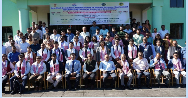
भा.वा.अ.शि.प.-व.व.अ.सं द्वारा बांस पौधशाला प्रबंधन पर एक प्रशिक्षण आयोजित किया गया