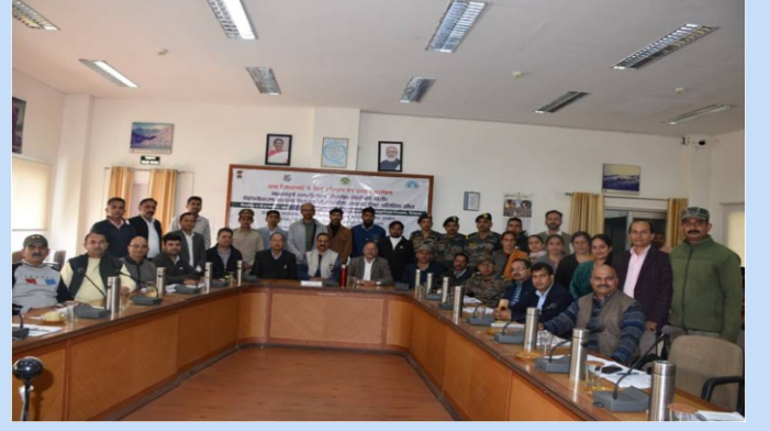
भा.वा.अ.शि.प.-हि.व.अ.सं. शिमला द्वारा महत्वपूर्ण शीतोष्ण औषधीय पौधों की खेती पर एक प्रशिक्षण कार्यक्रम आयोजित किया गया