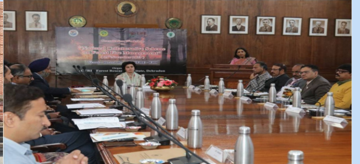
भा.वा.अ.शि.प.–वन अनुसंधान संस्थान द्वारा “वनाग्नि प्रबंधन पर राष्ट्रीय सहयोगात्मक योजना” के अंतर्गत एक परामर्शी कार्यशाला आयोजित की गई