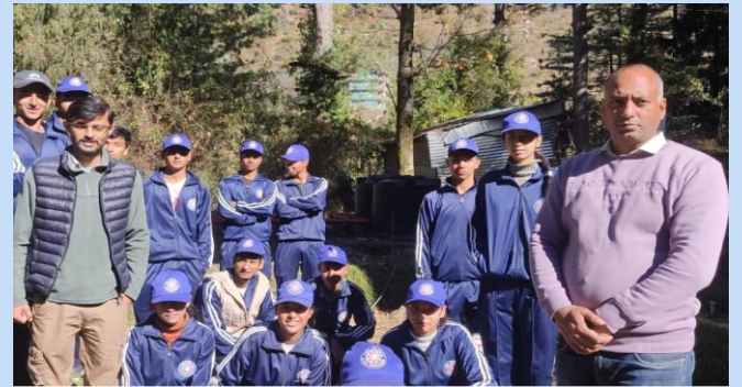
जीएसएसएस जगतसुख के एनसीसी वालंटियर्स को वीवीके, मनाली में हर्बल पौधों और पर्यावरण संरक्षण के बारे में जानकारी दी गई